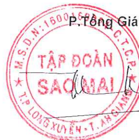
Trương Vĩnh Thành